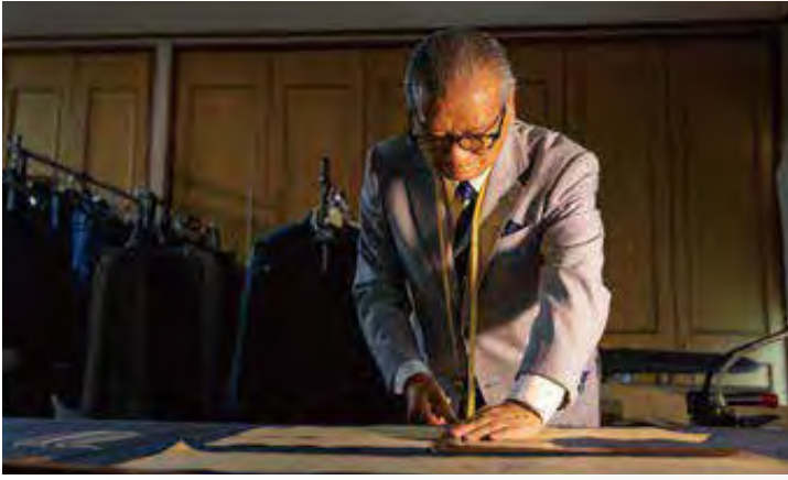
合理化が進むスーツ市場で、多くのテーラーが縫製工場に依頼する工程を、(アダムス)では5人のベテラン職人が一針一針手作業で一着を仕上げる。“真のビスポーク・テーラー”である。