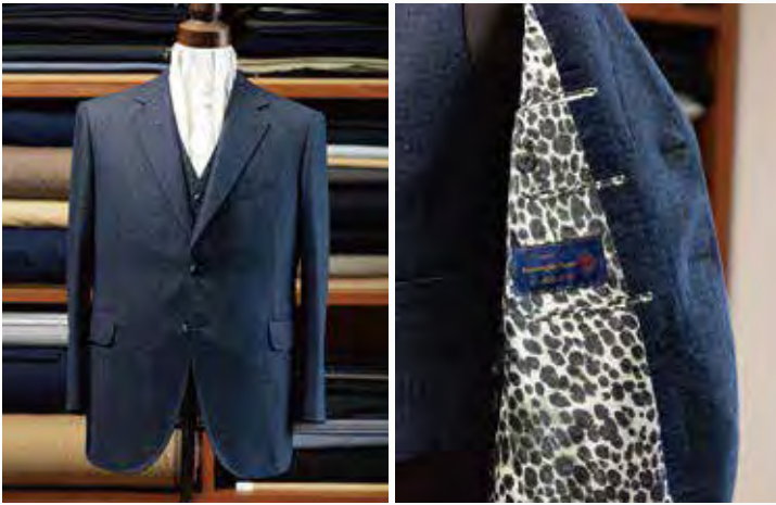
写真は、最高級生地「Ermenegildo Zegna」の「14 Milmil 14(14ミルミル)」で仕立てたフルオーダースーツ。豹柄の裏地がお洒落上級者を感じさせる。