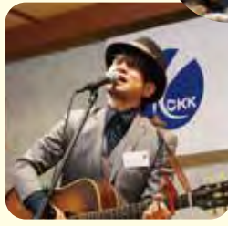
池端氏 (シンガーソングライター)