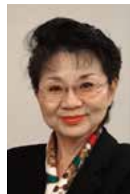
北九州市立大学 大学院 マネジメント研究科 前特任教授