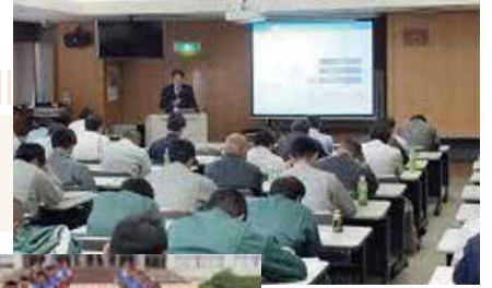
労働安全講習セミナー

会社紹介 名刺交換の時に「保険代理店です」と自己紹介すると「スーっ」と距離を取られてしまう…。そんな残念な出来事がしばしばあります(笑) 保険営業の負のイメージ?を払拭し、コンサルティングサービス、各種セミナーを開催するなど、有益で質の高い情報提供を心掛けています。3年前から約300名の外国人技能実習生を100社以上の企業に受け入れて頂くなど、日本の技術を学ぶ外国人と人材不足に悩む企業との懸け橋になれば幸いです。色々な業務を通じ皆様にとって一番身近で最良なビジネスパートナーを目指しています。どうぞ宜しくお願いいたします。