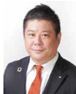
一般社団法人 北九州青年会議所 理事長