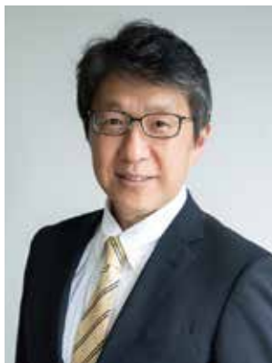
日本環境設計株式会社取締役会長