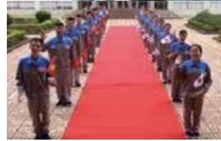
ベトナム人技能実習生現地研修風景