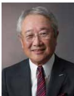
北九州市立大学 理事長 株式会社安川電機 代表取締役会長

今回のテーマ「伝統と革新のまちづくり」に関して、北九州市立大学関係者、地元老舗企業の経営者の皆様から素晴らしいご意見ご提案を頂きました。皆様とともに北九州青年会議所もこれからの北九州市の明るい未来に向け、地域のまちづくりにまい進してまいります。