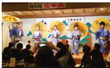
地域活性化委員会