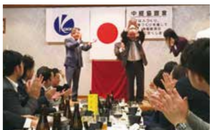
研修委員会・優勝おめでとう